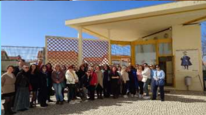
DELEGAȚIA DIN CELE 8 ȚĂRI