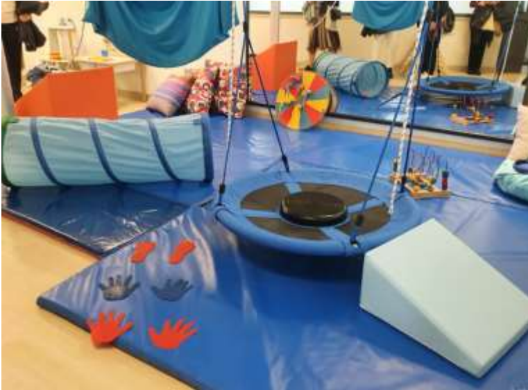
SALĂ PENTRU COPII