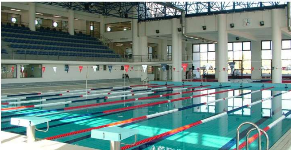
PISCINA MUNICIPAL CARLOS MANAFAIA