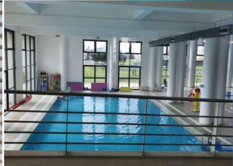
PISCINĂ DESCHISĂ PUBLICULUI, GRATUIT